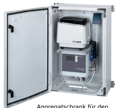
Aggregatschrank für den Innen- und Außenbereich