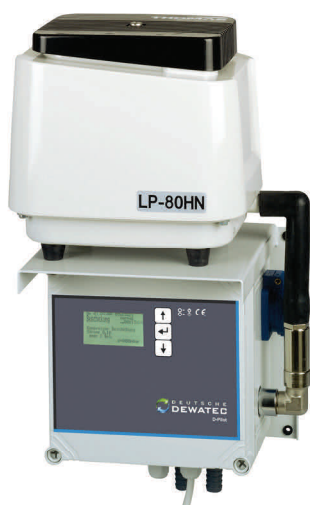
Aggregatkonsole für den wettergeschützten Innenbereich

Wetterfester Schaltschrank für den Einsatz im Außenbereich