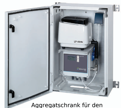
Aggregatschrank für den Innen- und Außenbereich