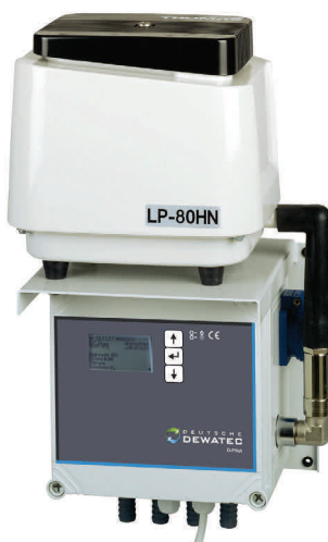
Aggregatkonsole für den wettergeschützten Innenbereich

Wetterfester Schaltschrank für den Einsatz im Außenbereich