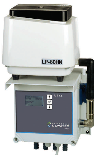
Aggregatkonsole für den wettergeschützten Innenbereich

Wetterfeste Freiluftsäule für den Einsatz im Außenbereich