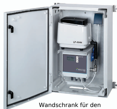
Wandschrank für den Innen- und Außenbereich