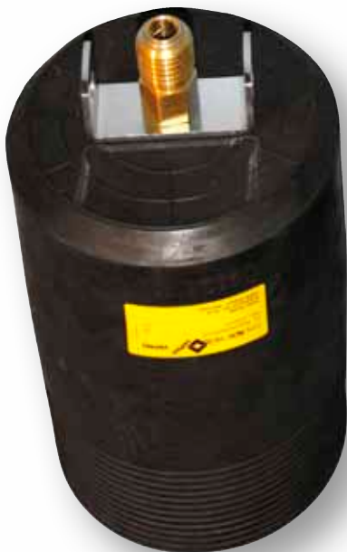
* RDK 15/30