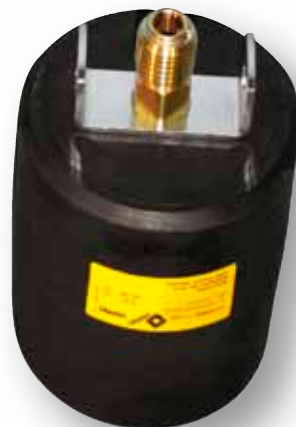
* RDK 12,5/20